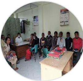
Jahresprojekt 2022 – Gefangenenseelsorge in Mymensingh, Bangladesch