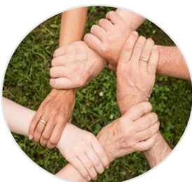
So können Sie unsere Arbeit unterstützen