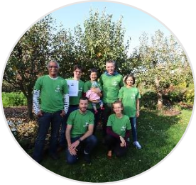
10 Jahre Deutsch-Bengalischer Freundeskreis – Vereinsgründung