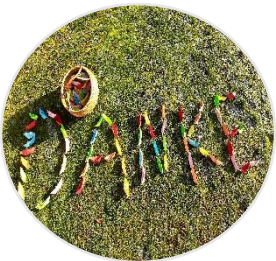
Aktivitäten und Spenden- einnahmen in 2022