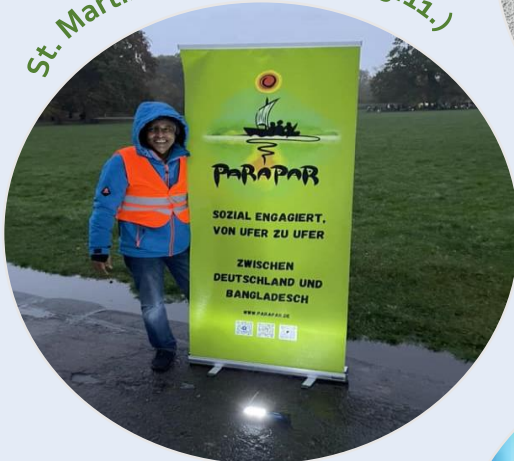
St. Martinsfest in Leipzig (13.11.)