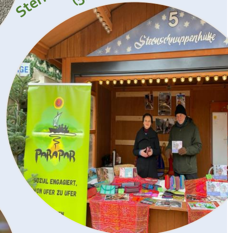
Sternlesmarkt in Ettlingen (5.+6.12.)