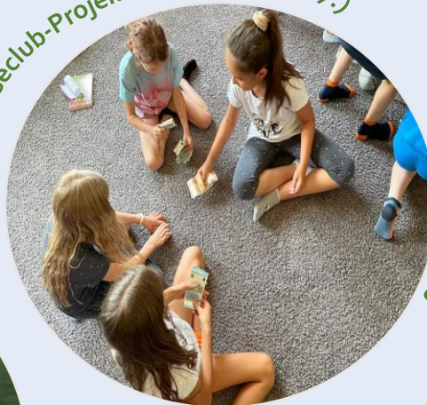
Leseclub-Projekt in Ettlingen (10.7.)